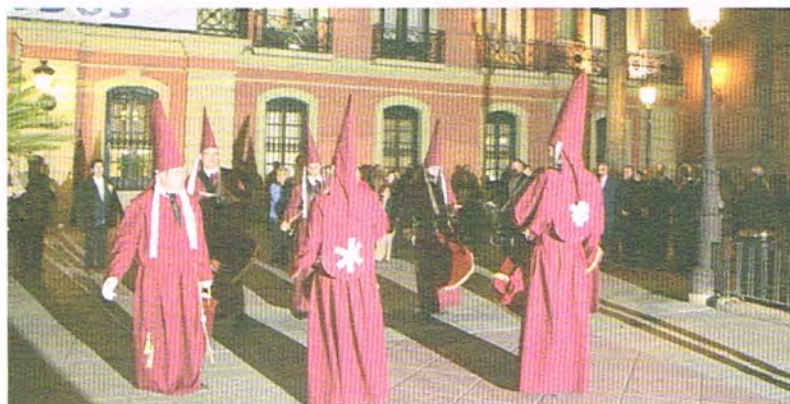
Instantes del acto de homenaje al nazareno frente al Ayuntamiento