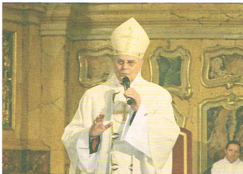
El arzobispo de Sevilla durante la homilía de la celebración Eucarística

El arzobispo de Sevilla, monseñor Carlos Amigo, celebró ayer la Eucaristía previa al comienzo de las sesiones correspondientes a la segunda Jornada del II Congreso Internacional de Cofradías y Hermandades. Amigo declaró durante su homilía que "quien lleva en su alma a Dios, observa todas las cosas con una luz penetrante y diferente. La esperanza es la luz que produce el fuego de la caridad y el amor. El Padre, quiere tanto a su hijo que vuelca en él toda su bondad, reflejando su viva imagen en Jesucristo, en el que se realiza el encuentro entre el hombre perfecto y Dios". El cardenal Amigo, ha concluido su plática dando gracias al Señor por dejarnos a su madre, la Virgen. ¿Podemos quedar en mejor compañía?, se ha preguntado.