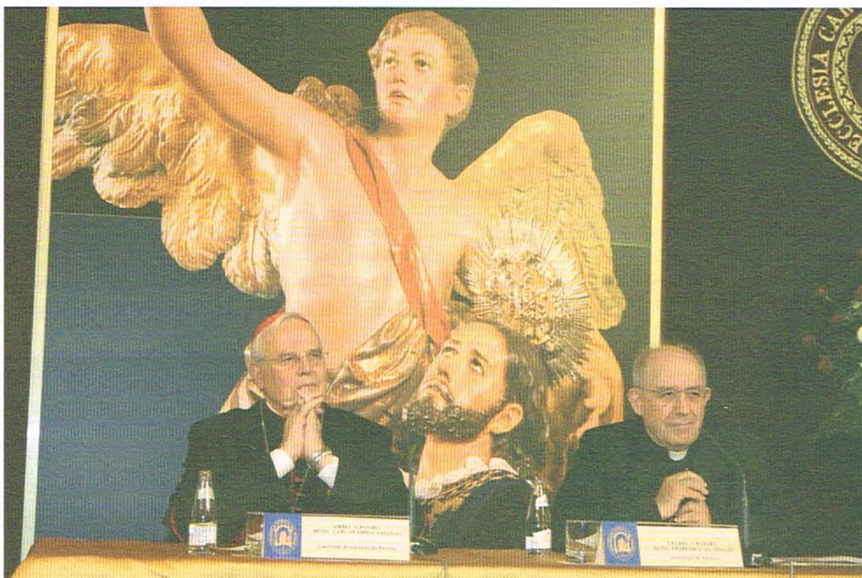
El Cardenal Amigo durante su intervención junto a monseñor Gil Hellín

El purpurado recalcó que "la imagen tiene que ser muy identificativa ya que de no ser así, puede que contemplarla no nos diga nada".