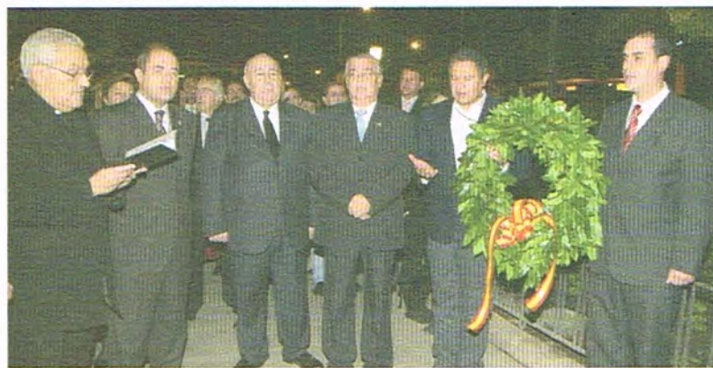
Asistentes al acto rezan un responso en memoria de los nazarenos fallecidos